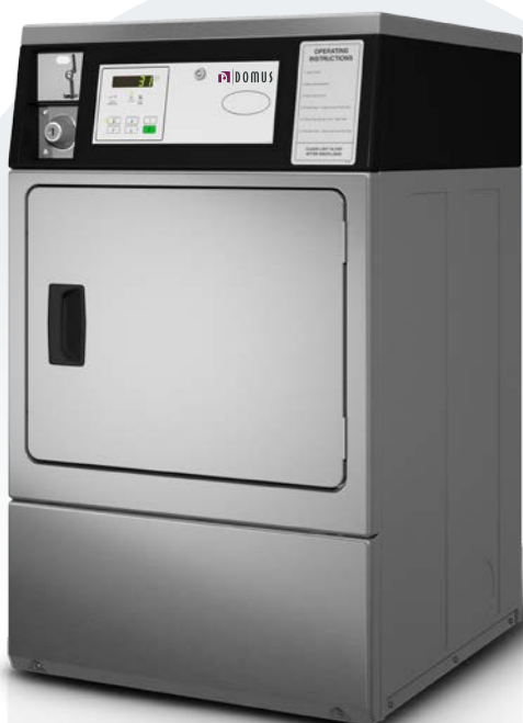
S-10 INOX COIN