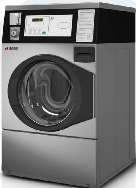
R-10 INOX COIN