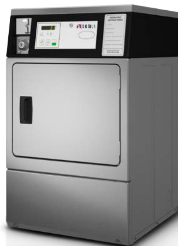
S-10 INOX COIN

MONEDERO FICHERO ELECTRÓNICO ELECTRONIC COIN-TOKEN BOX