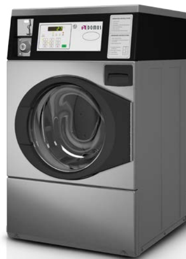
R-10 INOX COIN

MONEDERO FICHERO ELECTRÓNICO ELECTRONIC COIN-TOKEN BOX